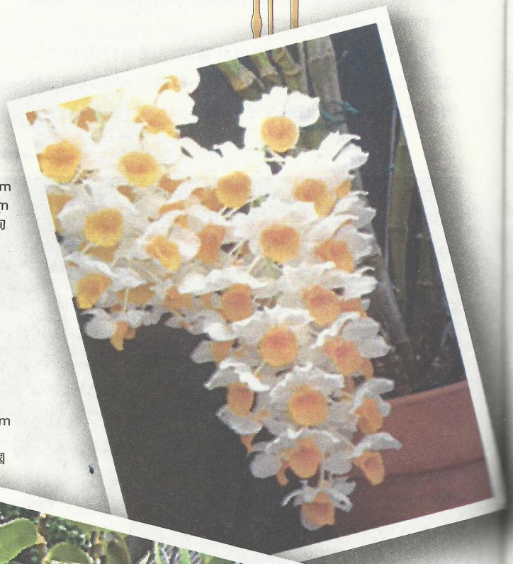
● Dendrobium amabile 越南和泰國